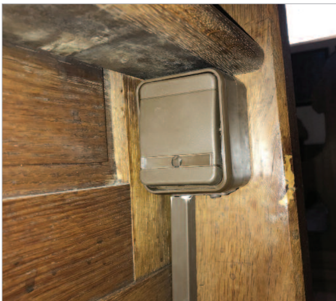
Abb. 3: Schalter in der Kirchenbank