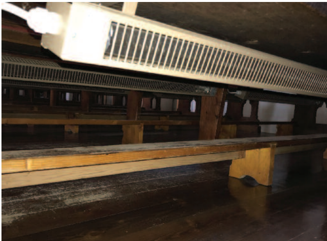
Abb. 3: Neue Heizpanele