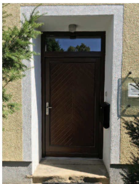
Abb. 1: Eingangstüre vorne

Im Folgenden einige Impressionen des 1. Energieaktionstages.