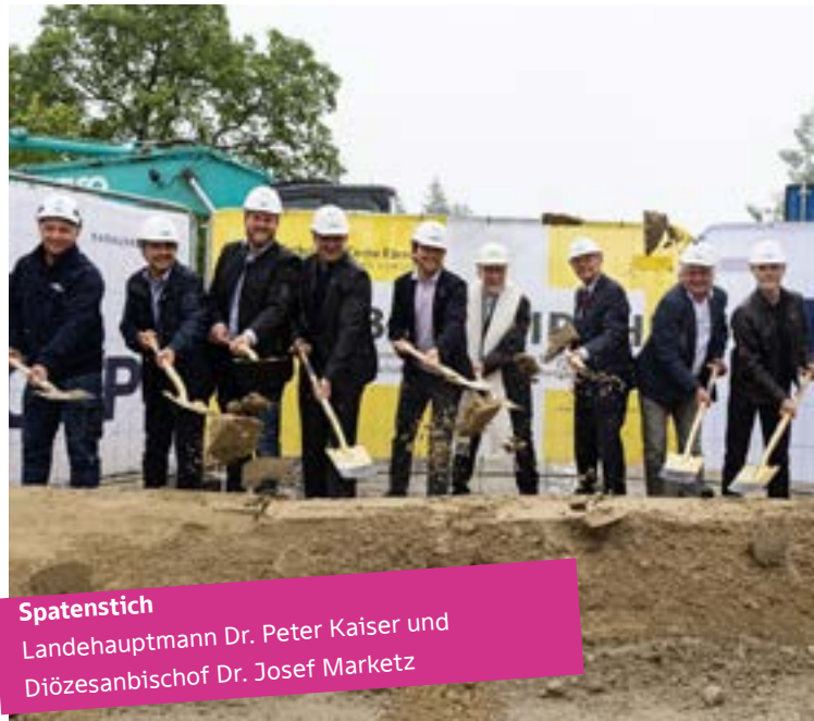
Spatenstich Landeshauptmann Dr. Peter Kaiser und Diözesanbischof Dr. Josef Marketz

Es wurde in den Planungen darauf Wert gelegt, den bestehende Pfarrhof mit einem großen Saal zu verbinden und bereits bestehende Gebäudeflächen bestmöglich zu integrieren und zu revitalisieren. Es wird möglichst schonend gebaut, da keine zusätzlichen Flächen versiegelt werden, weil ein bestehender Zubau für das Projekt abgerissen wurde. Der neue Bau wird zum großen Teil unterirdisch liegen und intensiv begrünt werden. Darüber hinaus wurde die Ölheizung durch eine Pelletsheizung ersetzt und es wird eine PV-Anlage am Bestandsgebäude errichtet. Zu den größten Herausforderungen zählte es unter anderem die Diözese von diesem Projekt zu überzeugen sowie bei den aktuell hohen Baukosten eine gangbare Lösung zu finden. Beides konnte durch Dialog und aufeinander Zugehen überwunden werden.