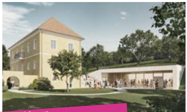
Visualisierung geplante Fertigstellung Frühjahr 2024