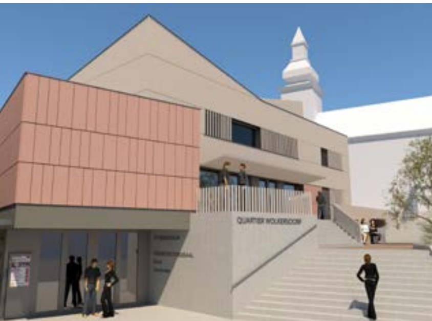
© Atelier Deubner Lopez ZT OG

Mit dem Bauvorhaben Pfarrzentrum Wolkersdorf wird ein in jeglicher Hinsicht ökologisch vorbildliches Projekt realisiert. Dies betrifft den Bauablauf selbst, die energetische Fremd- und Eigenversorgung, die eingesetzten Baumaterialien sowie die langfristige Nachhaltigkeit im Sinne von Pflege- und Wartungsarbeiten. Das Projekt hat für die Planung bereits die „klimaaktiv Gold“ Auszeichnung erhalten.