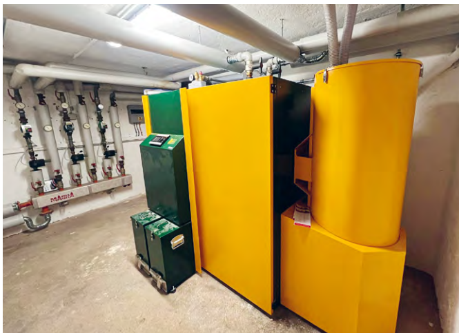
Zeitenwende im Heizungsraum Die Pfarre Maria Lourdes hat die Gasheizung (links) durch ein modernes Pelletsystem (rechts) ersetzt.