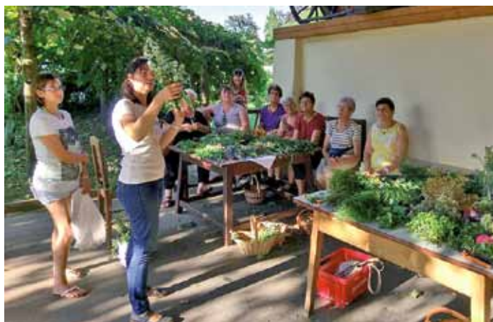
Kräuterbuschenbinden mit der Frauenbewegung