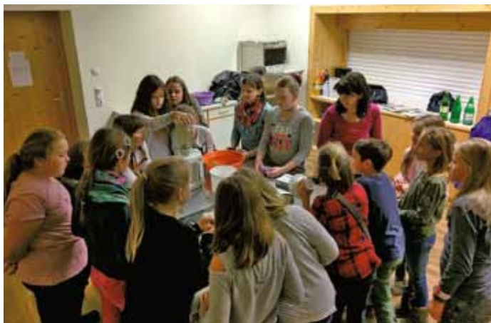
MinistrantInnen bereiten Kräutersalz zu.

verschlossen, damit kein wertvolles Aroma verloren ging. Die Kräutersäckchen wurden nach der Sonntagsmesse gegen eine freiwillige Spende angeboten.