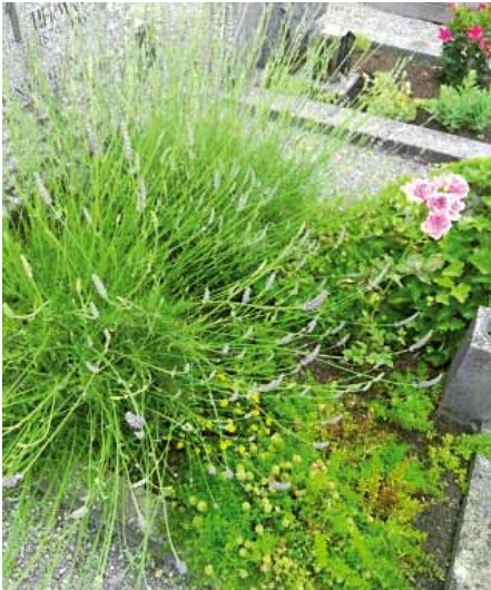
Gräber ökologisch wertvoll gestalten

Die Pfarre St. Sebastian Hard, seit 2012 frei von Glyphosat, ist Teil des Pilotprojekts natur.oase.friedhof.