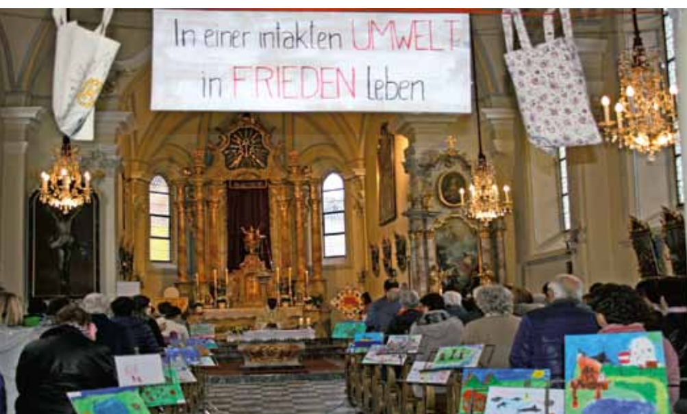
Dankgottesdienst mit Ausstellung der Volksschulkinder

Neben diesem umfangreichen Beschaffungsprojekt wurde auch ein Energieprojekt eingereicht: im Pfarrzentrum Widum wurde in bisher leerstehenden Räumlichkeiten von heimischen Betrieben eine Gemeinschaftsküche mit energieeffizienten Geräten errichtet.