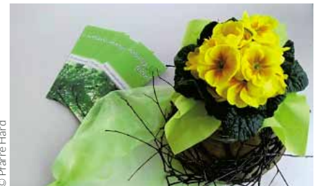
Natürlich gefeiertes Pfarrfest

Das Pfarrfest – auch bislang schon mit Mehrweg, wenig Müll und vegetarischem Angebot gefeiert – punktete heuer mit sanfter Anreise. Als Teil des Projekts „f5-Pfarrgemeinde“ ist die Pfarre Hard sehr um Schöpfungsfreundlichkeit bemüht.