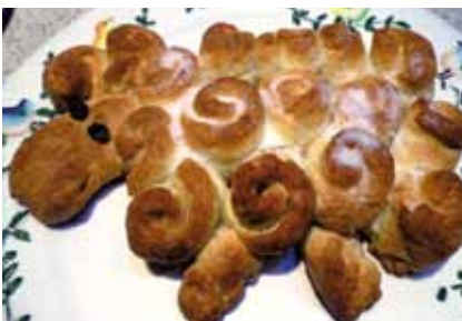
Das nachhaltige Osterlamm

Die Pfarre möchte möglichst viele Restlessen-Rezepte sammeln und in gebundener Heftform veröffentlichen. Dabei werden die älteren BewohnerInnen Rehhofs animiert, ihr Wissen weiterzugeben, und die Jungen profitieren von dieser Ideen-Küche. Einladungen zum Aufschreiben der Rezepte gibt es nach der Sonntagsmesse, sowie im wöchentlichen elektronischen Pfarrbrief. Ein guter Vorstellungstermin wäre das Erntedankfest in Verbindung mit einem Restlessen-Fest.