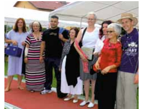
Kost nix und trotzdem wunderschön