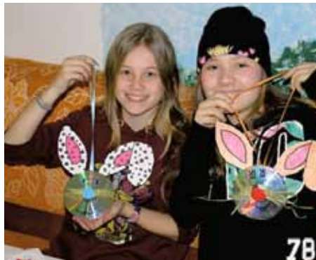
Der Osterhase hat nur Musik im Kopf!

ist und bleibt aber das Bemühen, einen gerechten und zukunftsfähigen Lebensstil zu entwickeln und als Dimension christlichen Handelns einzuüben..