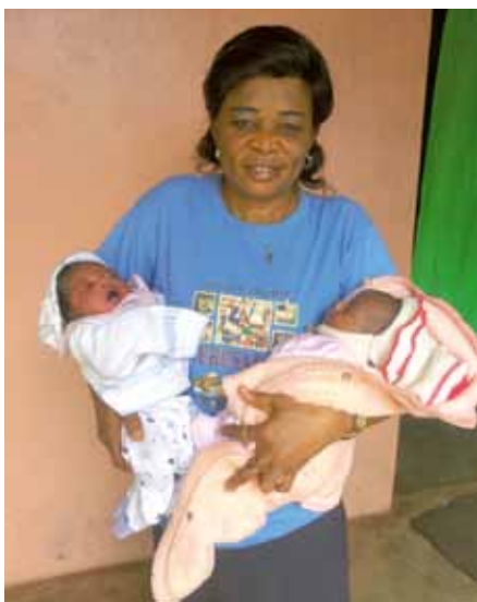
Hebamme in der nigerianischen Geburtenstation