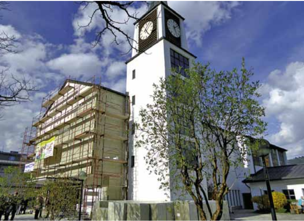
Thermische Außensanierung der Kirche Schüttdorf

Zum 50-Jahr-Jubiläum vollständiger Umstieg auf erneuerbare Heizung geschafft